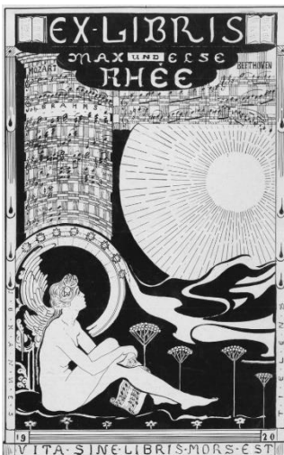
Ex libris der Eheleute Max Rhée.